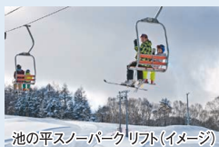
池の平スノーパークリフト(イメージ)