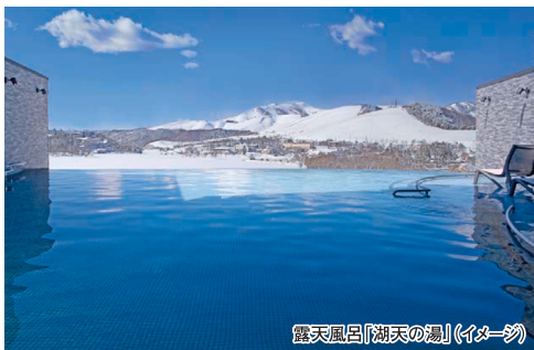
露天風呂「湖天の湯」(イメージ)