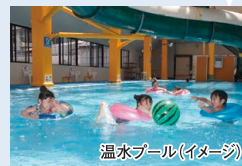
温水プール(イメージ)