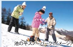
池の平スノーパーク(イメージ)