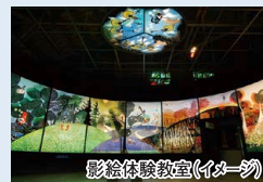
影絵体験教室(イメージ)

※ご利用特典は当日お選びください。特典チケットは当日8:00よりフロントにてお渡しが可能です。 ※レンタルスキーは池の平スノーパーク・白樺高原アクティビティパーク、レンタルスノーボードは池の平スノーパークで適用可能